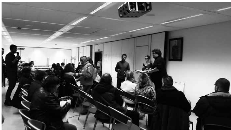
Mensen in armoede vinden het belangrijk om vragen te stellen over de doelstelling, de voorwaarden en de finaliteit van participatie.

“Als er met je verhaal op weg gegaan wordt, dan voel je je beluisterd en weet je dat de problemen worden aangekaart.”