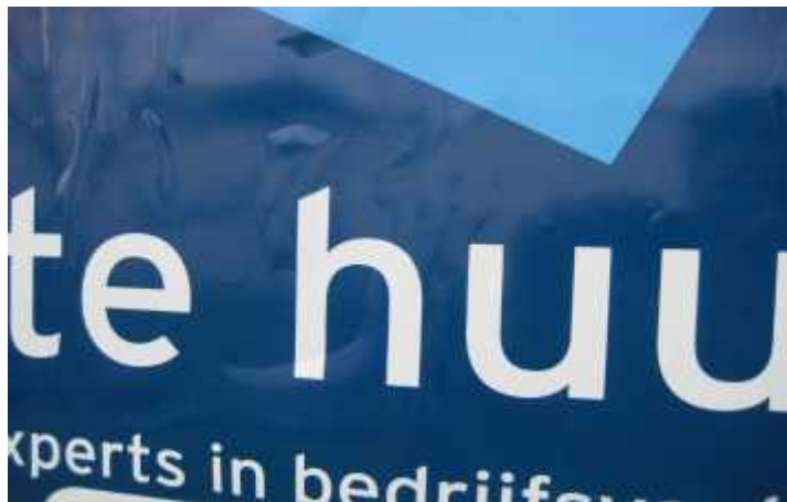
Woning te huur? Voor velen niet zo evident meer...

Wie kwetsbare mensen begeleidt bij hun intrede op de woonmarkt, botst op de zogenaamde 'monopolierente' die huiseigenaars kunnen vragen. Een monopolierente wordt betaald omwille van een zekere exclusiviteit van een woning. In de hogere prijsklassen slaat dat bijvoorbeeld op een woning met zicht op zee of op café Zeezicht. Aan de onderkant van de woningmarkt haalt de eigenaar echter een 'monopolieprijs uit schaarste': minder kapitaalkrachtige groepen moeten op een of andere manier een woning vinden op een krappe markt, terwijl private verhuurders hun kandidaat-huurders steeds meer selecteren op basis van bijkomende inlichtingen en eisen (zoals de naam van de werkgever en de vorige verhuurder). Onderzoek toont aan dat in het onderste segment de verhuurder over een verhuurgarantie beschikt, zelfs als de woning niet voldoet aan de minimale kwaliteitsnormen. Dat hoeft trouwens geen verwondering te wekken met een aanbod van amper 6 % sociale huurwoningen.